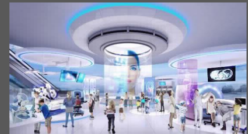
『未来の医療サービス』