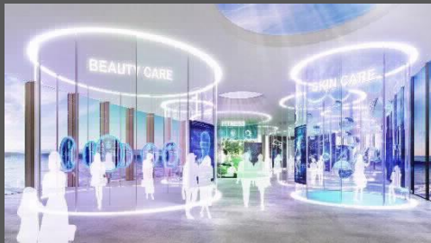
『未来のヘルスケア体験』