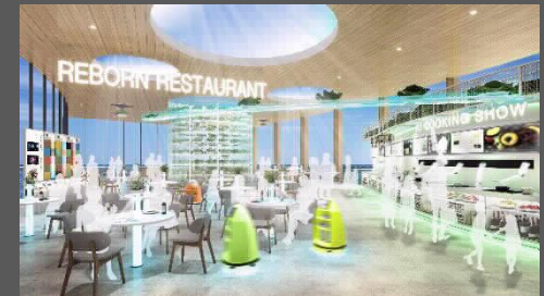
『未来のフードスタンド』