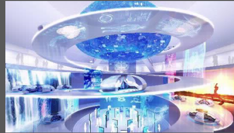
『都市移動用のモビリティ』