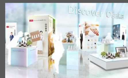
『中小企業・スタートアップ展示』