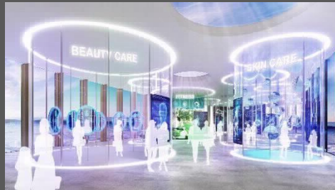
『未来のヘルスケア体験』