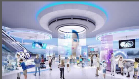
『未来の医療サービス』