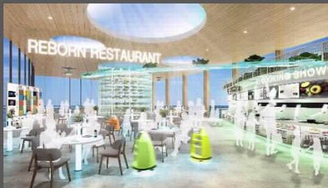
『未来のフードスタンド』