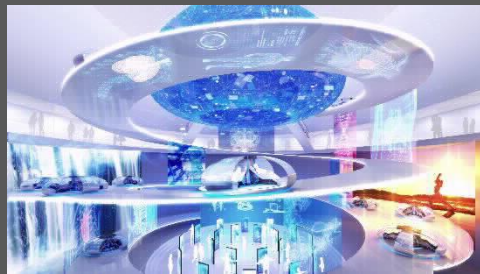
『都市移動用のモビリティ』