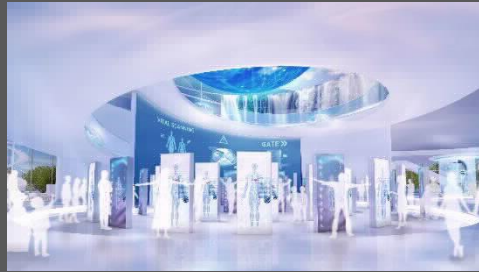
『街中に存在するスキャニングマシン』

大阪パビリオン全体を「未来の都市生活」として描き 来館者を未来都市に生きる生活者としてコンテンツや体験を設計し演出